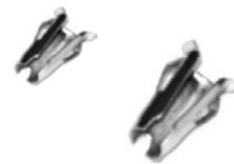
Presilha Emblema do Capô (Cafezinho) 002.988.7778