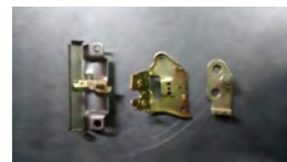
Fechaduras para veículos

JPM Industria e Comercio de Artefatos de Metal Ltda.