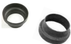
Defletor Eixo "S" 346.423.0058