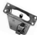
Ferragem da Fechadura 331.880.7060