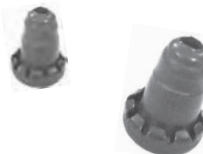
Respiro Diferencial 312.350.1090