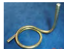
Cano Torto 344.351.7066