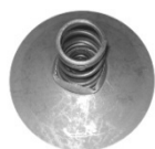
Prato Filtro Lubrificante OM352 345.431.0088