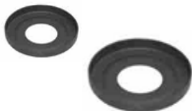
Tampa Rolamento Virabrequim 312.031.0533