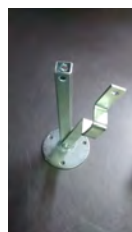
Suporte para Galão