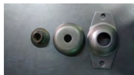
Peça para Trator